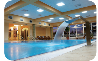
Piscinas y spas