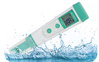
Resistencia al agua y polvo IP67