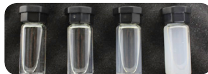
0.02 NTU, 20.0 NTU, 100 NTU, 800 NTU

Provee 4 tipos de soluciones estándar, fáciles usar, de polímero de alto peso molecular Reagecon (0.02 NTU, 20.0 NTU, 100 NTU, 800 NTU), U.S. Certificación EPA, no-tóxico, y fácil de usar, el cual tiene amplias ventajas en comparación a las soluciones estándar de Formazin